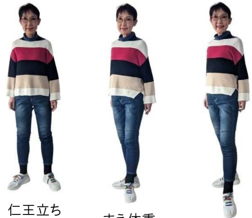
仁王立ち (左右均等)

立ったら「うしろ体重」 …お手元の雑誌などペラペラめくってみてください。モデルさんはほとんど「うしろ体重」で立っています。これも、足を長く見せるテクニック。具体的には、足を前後に開き、つま先は外向き。体重を後ろ脚にかけて、前足のつま先をカメラ方向に伸ばします。これで身体は自然に斜めに構えることになります。